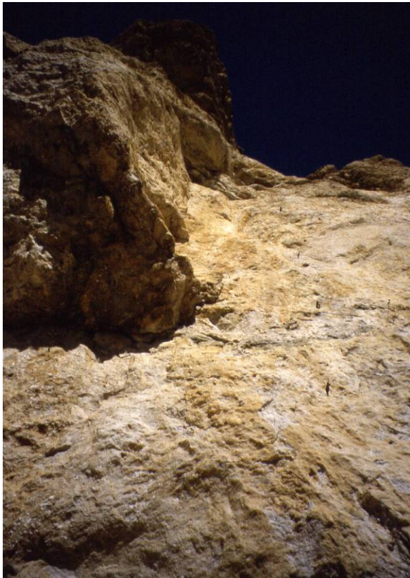
Strapiombo più, strapiombo meno.