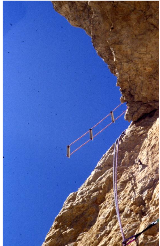
..ma il cielo è sempre più blu.