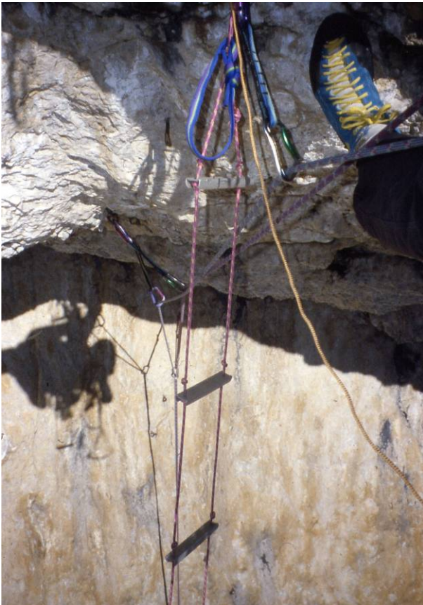
Ombre riflesse "strapiombanti"