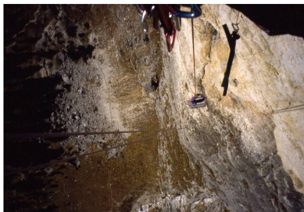
...e da sopra