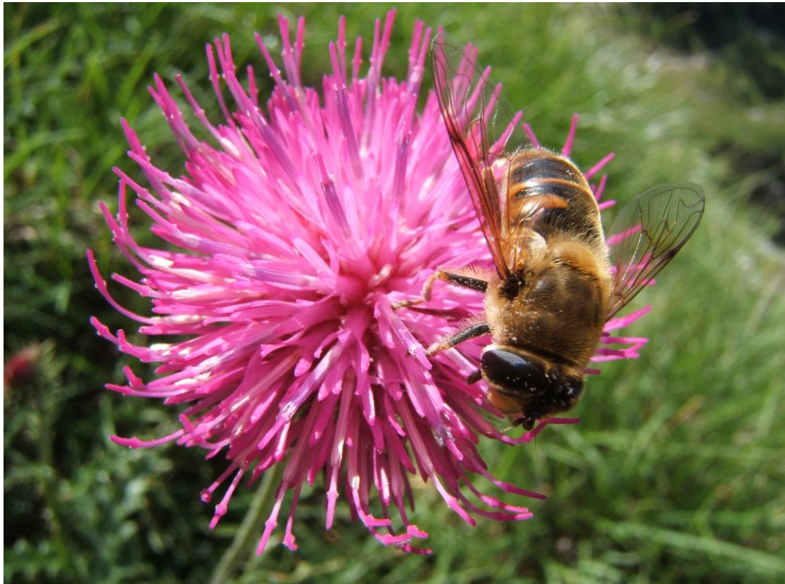
Vista la scarsa frequentazione e la buona conservazione dell'ambiente...