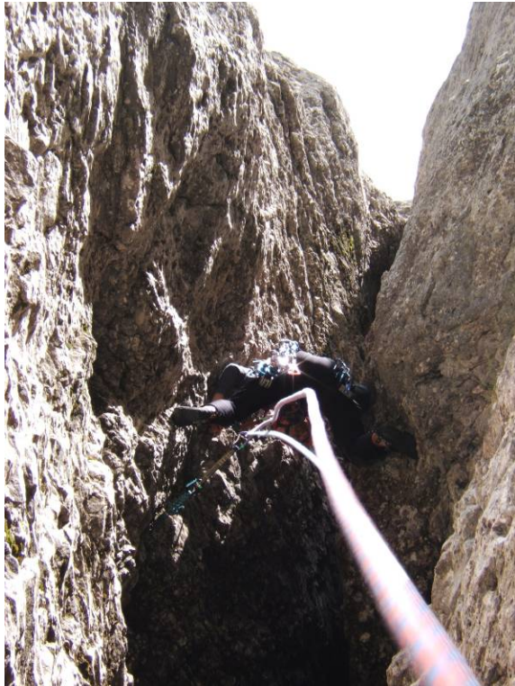
Camino ed opposizione