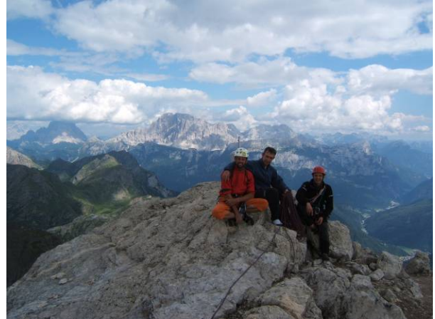
In cima: verso la Civetta