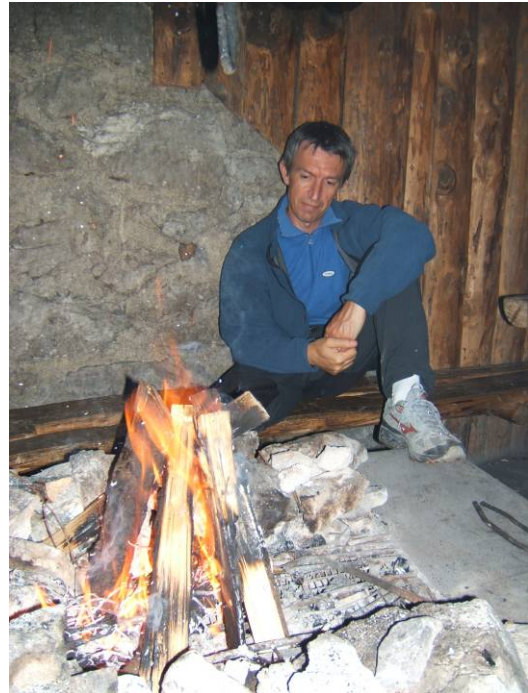
Tranquillità in bivacco