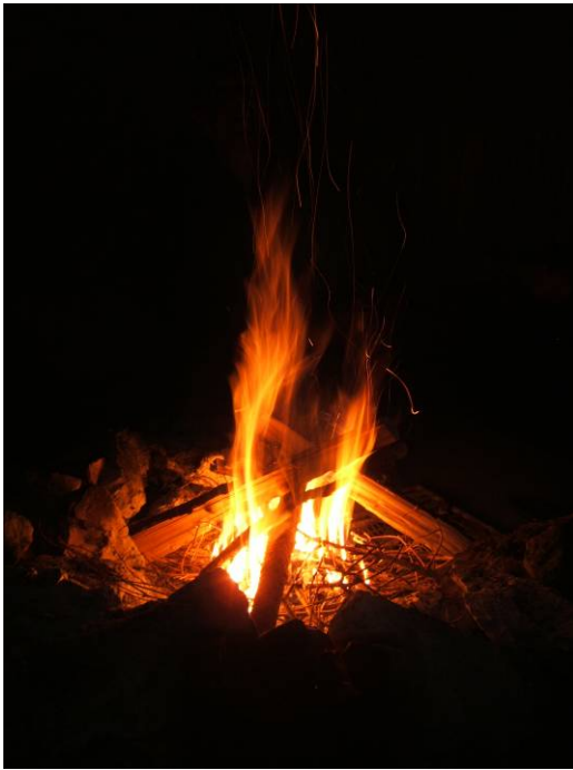
Fuoco, calore, vita