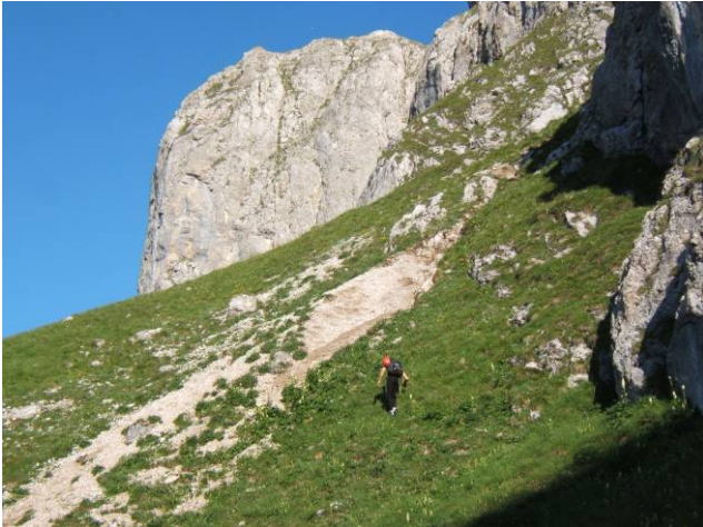
Sul pendio verso l'attacco