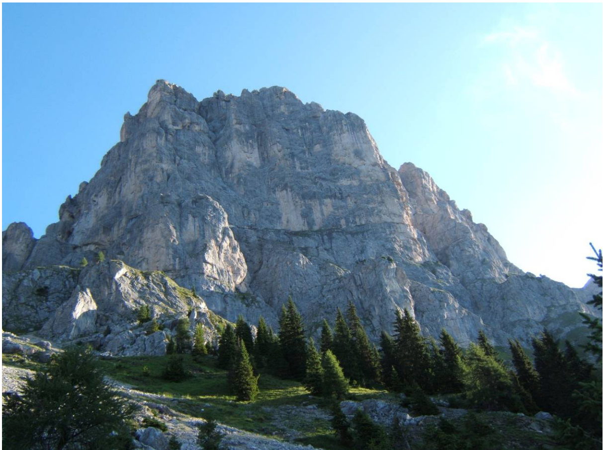
La parete: un tenue profilo di luce segna il pendio che conduce alla cengia erbosa d'attacco