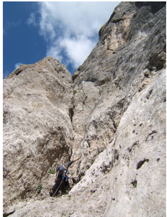
Roccia compatta e salda