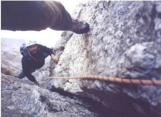
Poco sotto l'uscita