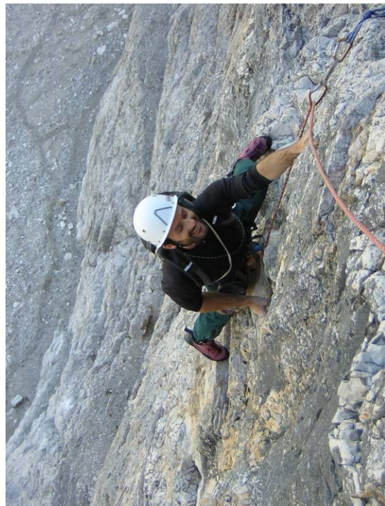
Salendo la "Comici" alla Grande