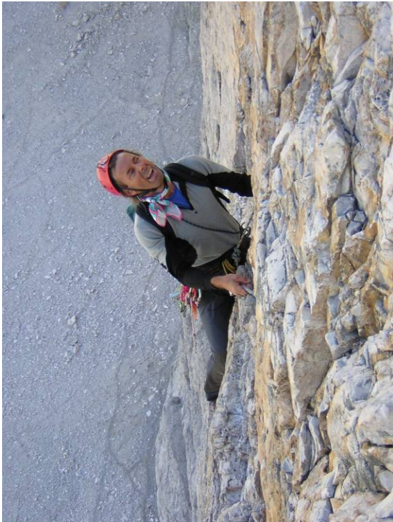
E' dritta, è dritta!