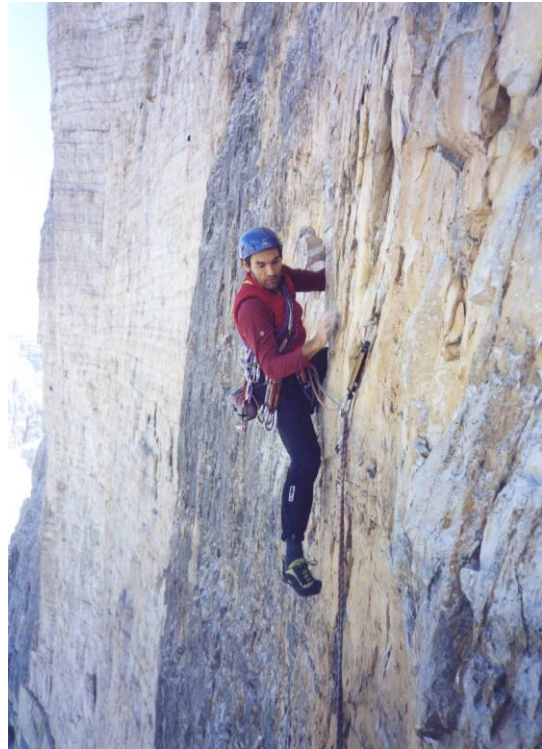
Sul muro vertical-strapiombante d'attacco