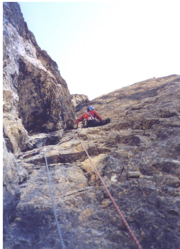
L'ultimo "osso duro"