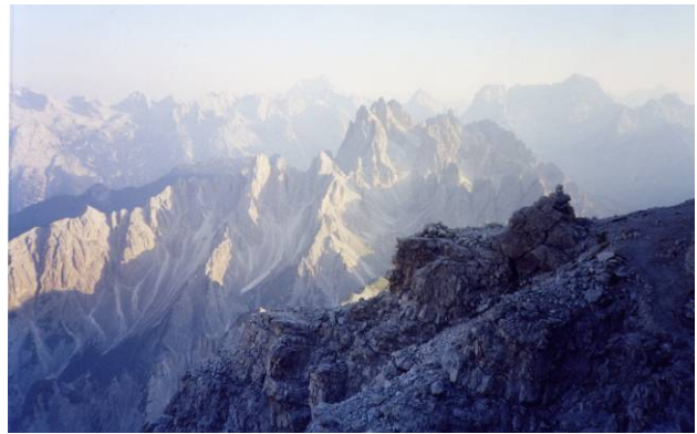
In discesa: uno sguardo ai Cadini di Misurina