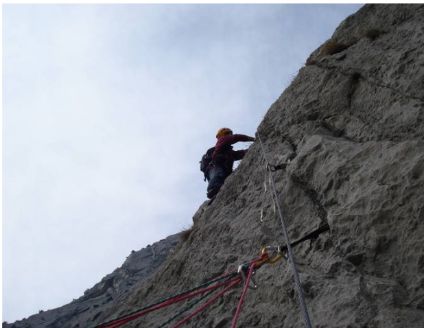
Stessa placca, diverso interprete