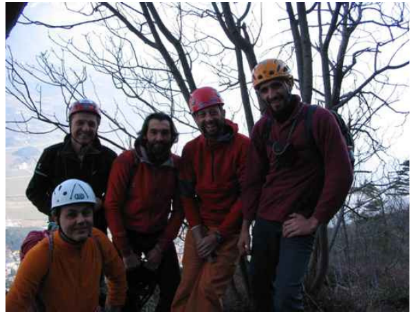
Due cordate al cospetto di "Einstein"