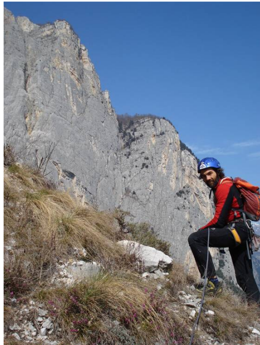
I Pilastrini del Casale osservano