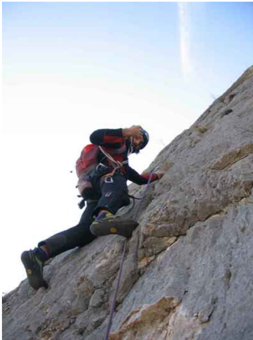
Sulla fessura d'uscita