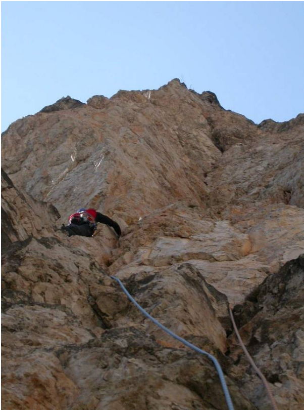
Inoltrandosi "direttamente" fra strapiombi