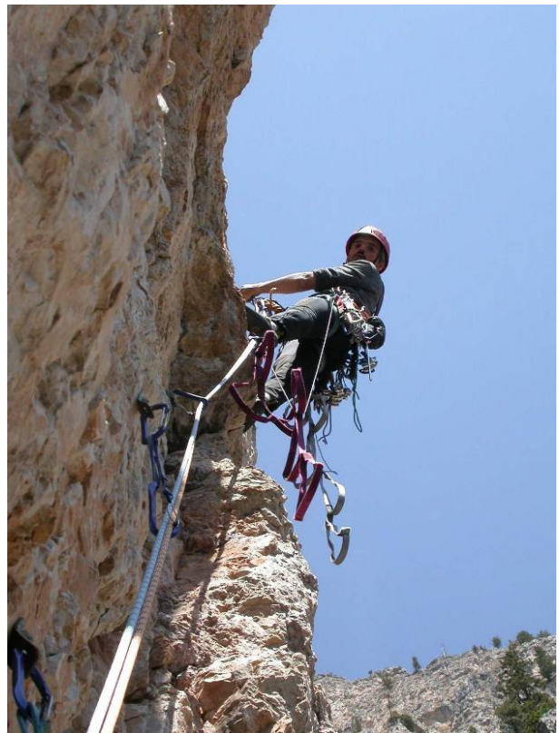
Progressione in artificiale