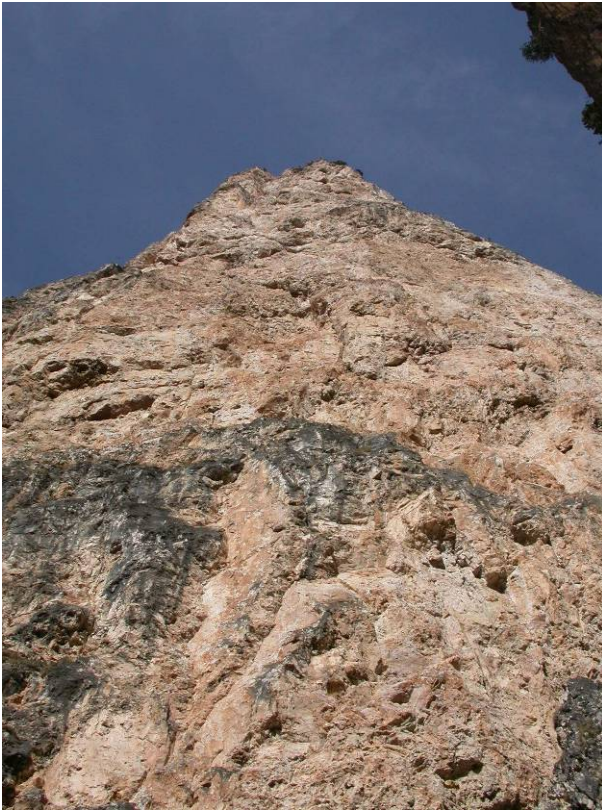
Campanile di Vallunga, Parete Est