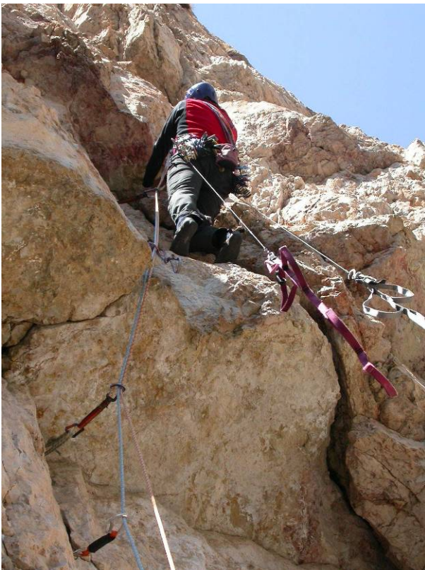
...e superamento di un tetto