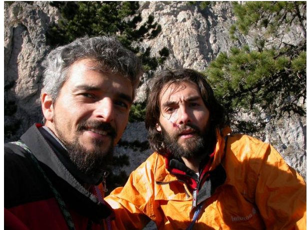
Verso una tavola imbandita per un compleanno