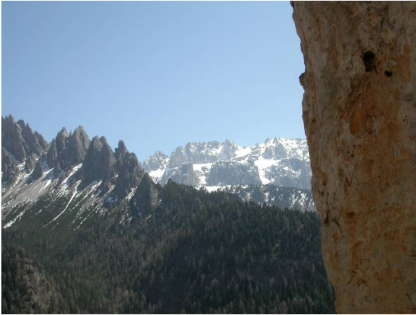
Un po' di panorama