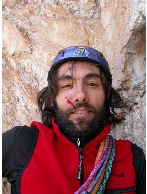
Effetto "sasso in faccia"