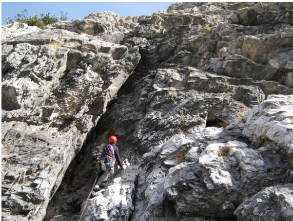
Il camino d'attacco