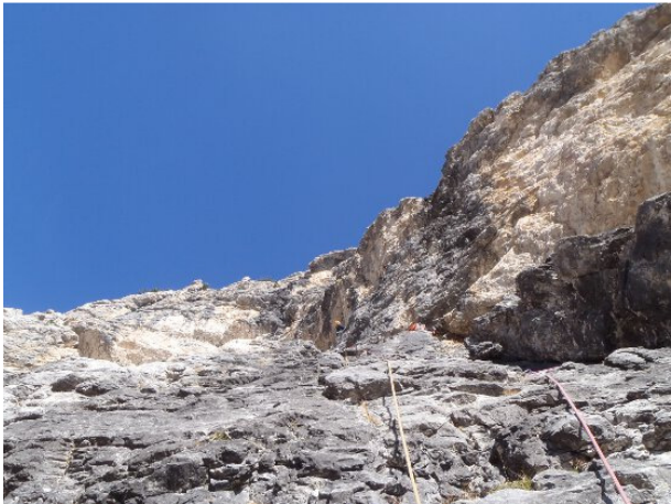
Le lunghezze centrali della via