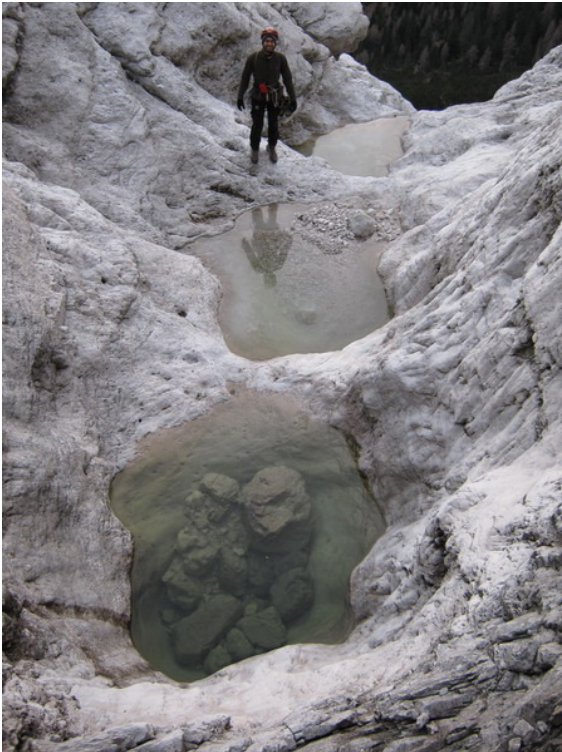
Acqua o ghiaccio?