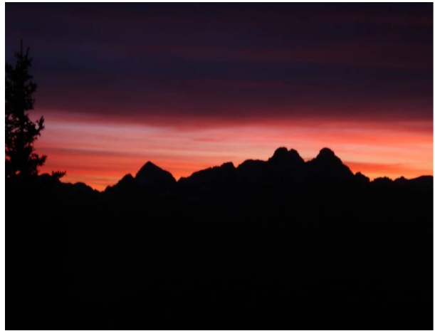
La magia del tramonto