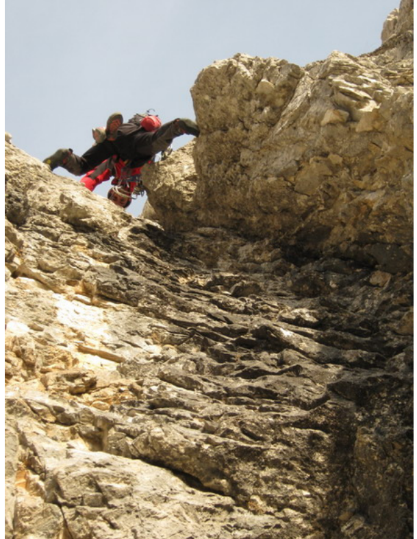
Lungo il colatoio terminale