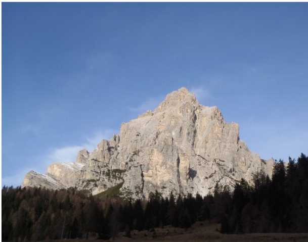
La Moiazza da Passo Duran