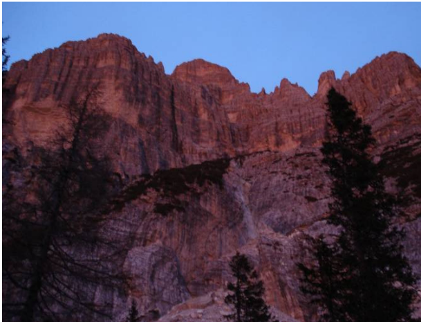
"Enrosadira" sulle cime della Moiazza