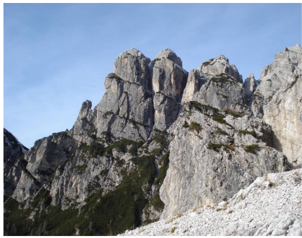
Le Torri del Camp