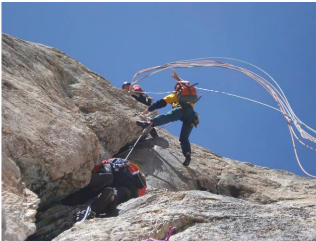
Assalto alla "Fessura della Valgrande"