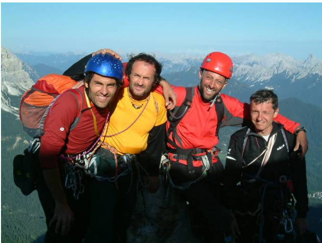
In cima: tutti!