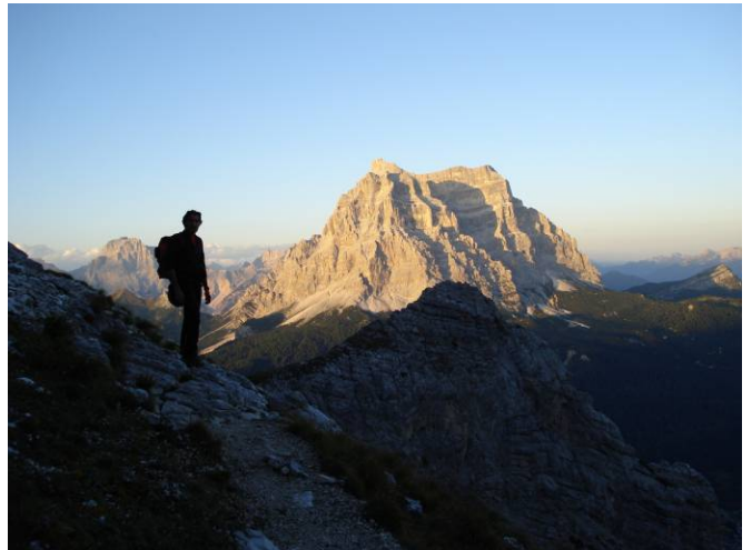
Il Pelmo, signore delle Dolomiti.