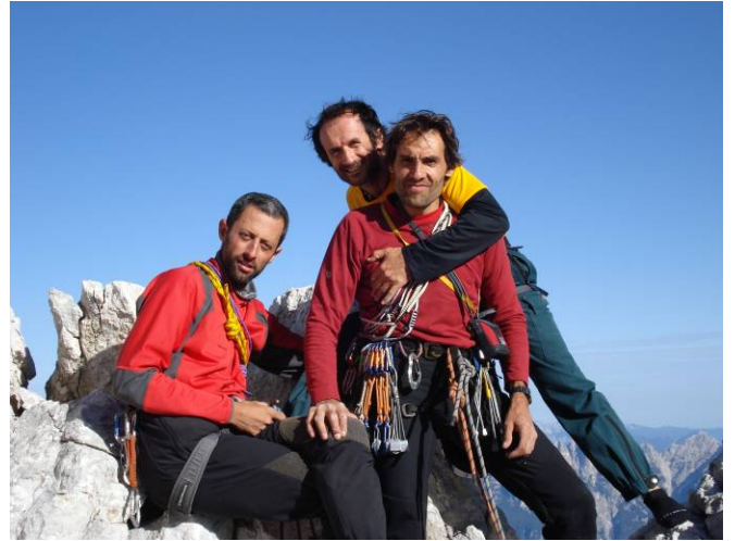
In cima: quasi tutti.