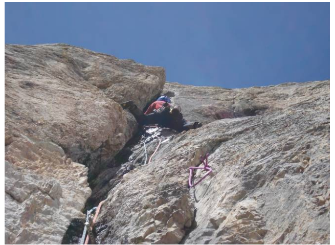
...strapiombante, liscia e bagnata