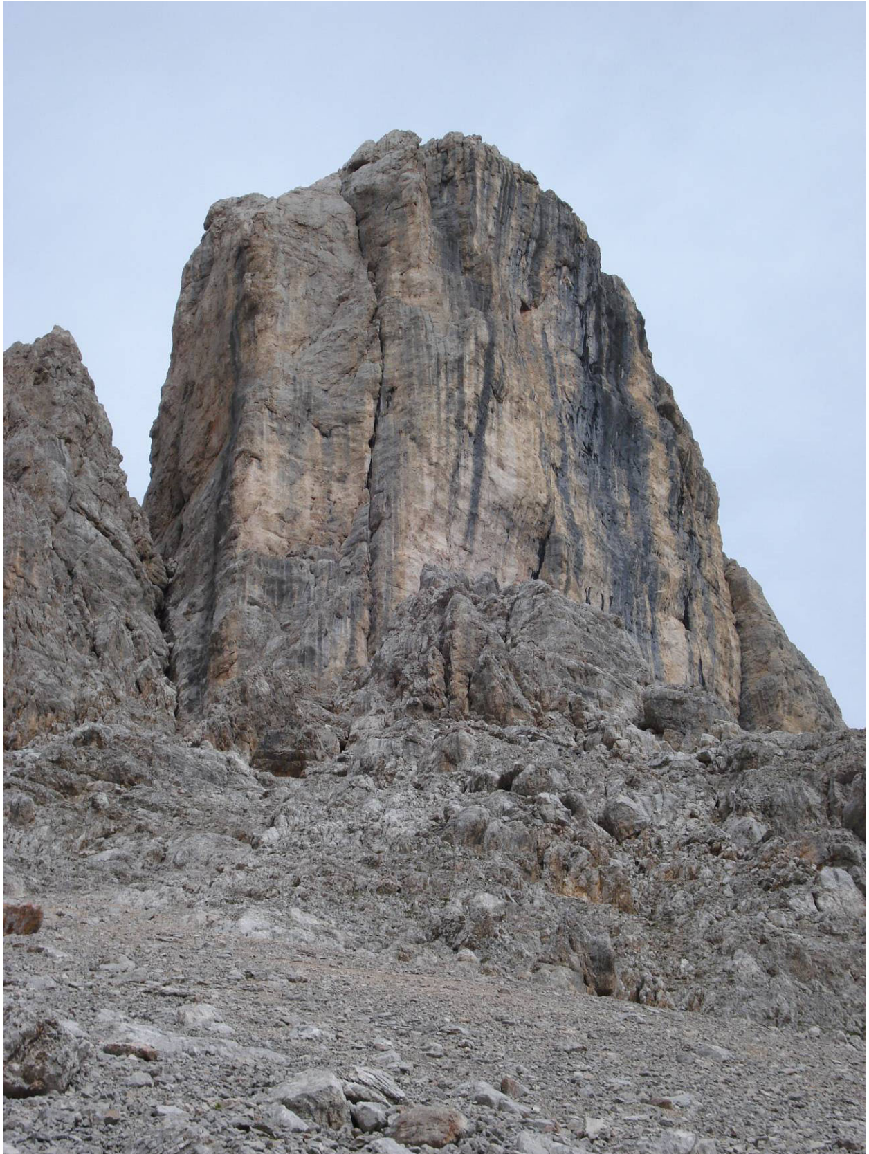
Torre di Valgrande, parete Sud. "Via delle Guide"