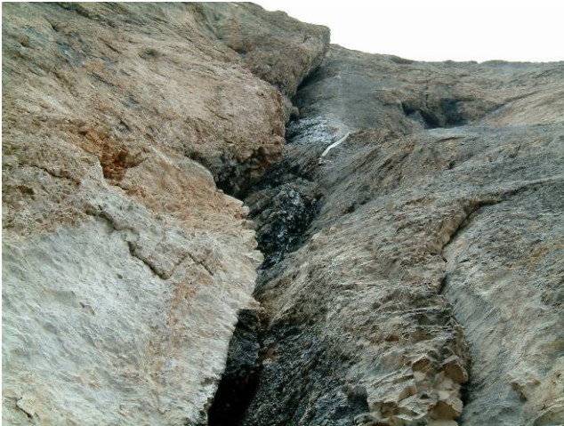
...si apre a mò di tromba