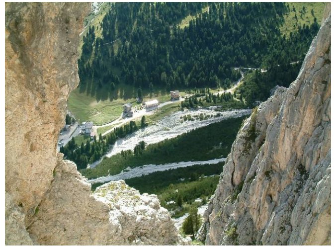
La conca di Gardeccia