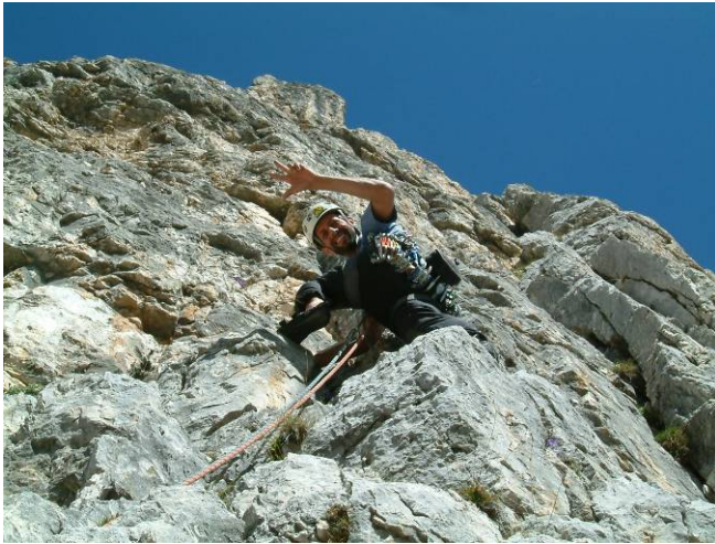
...e cerchiamo di tradurlo bene