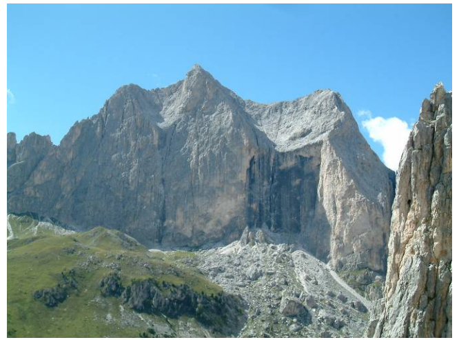
Catinaccio parete Est