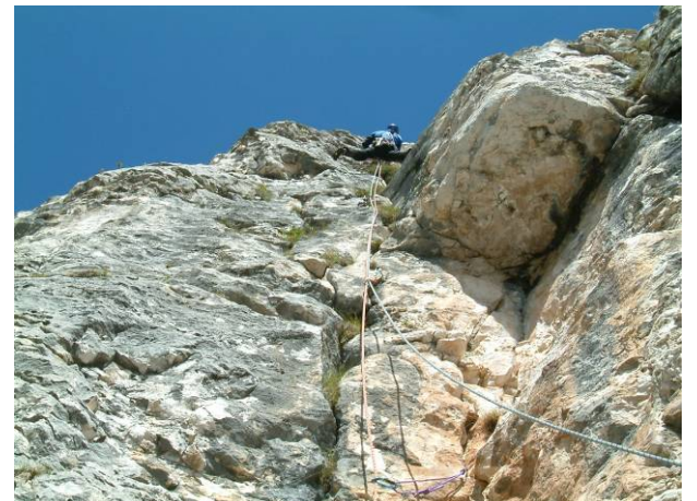
Impariamo a "tradurre" G. Battisti