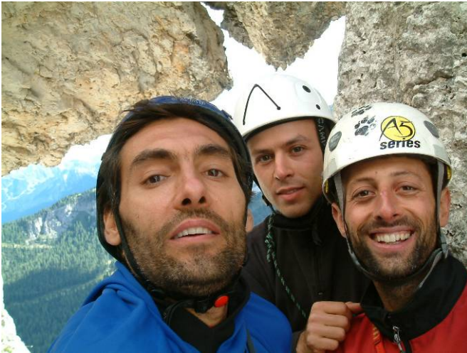
In cima. Abbiamo fatto una buona traduzione!